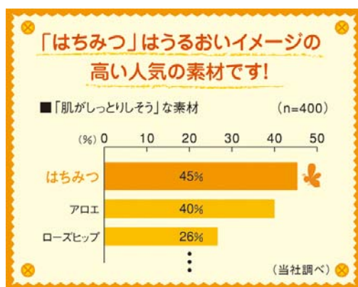
<はちみつと潤いイメージの調査>