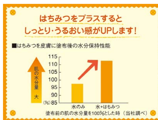
<はちみつ配合の潤い効果>