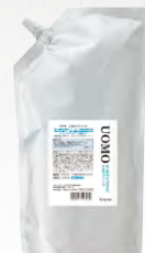
ウオモ スカルプトニック (養毛料) 1,000mL