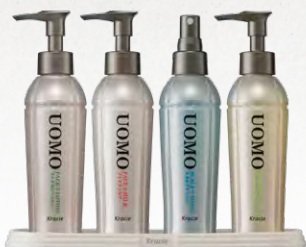
化粧品トレー(4品セット例) 232×70×190mm