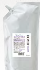
ウオモ フェイスウォッシュ (洗顔料) 1,000mL