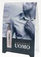
ウオモ ブランドPOP 95×40×140mm