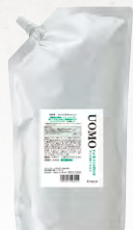
ウオモ フェイスローション (化粧水) 1,000mL