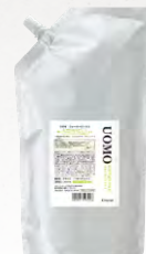
ウオモ ウォーターワックス (スタイリング) 1,000mL