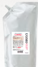
ウオモ フェイスミルク (乳液) 1,000mL