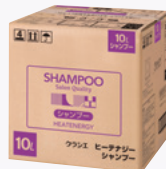
ヒーテナジー シャンプー