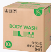
クラシエ ボディソープ(HT)