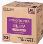
ヒーテナジー コンディショナー