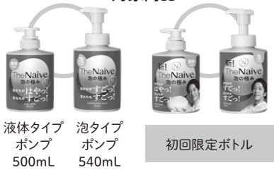
液体タイプ ポンプ 500mL 泡タイプ ポンプ 540mL 初回限定ボトル