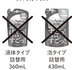
液体タイプ 詰替用 360mL 泡タイプ 詰替用 430mL

The Naive ボディソープ 液体タイプ ポンプ 500mL (初回限定ボトルを含む)