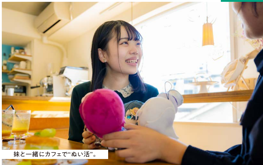
妹と一緒にカフェで“ぬい活”。