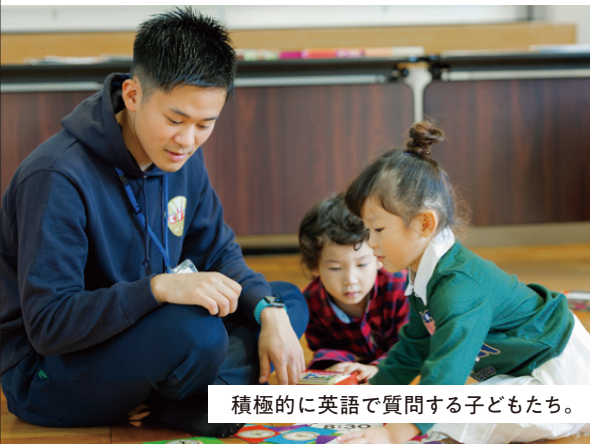
積極的に英語で質問する子どもたち。