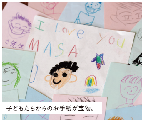
子どもたちからのお手紙が宝物。