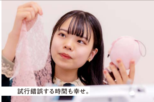
試行錯誤する時間も幸せ。