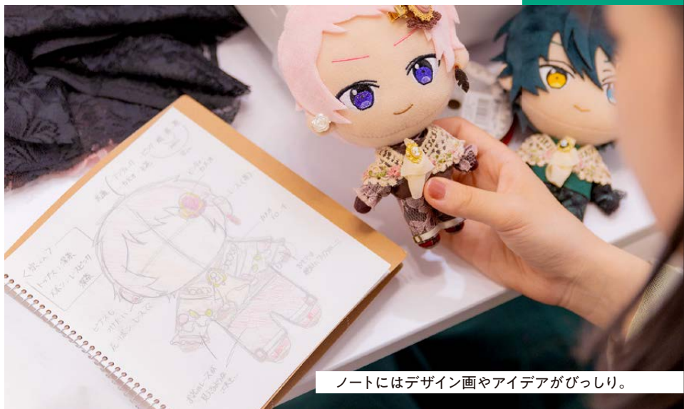
ノートにはデザイン画やアイデアがびっしり。